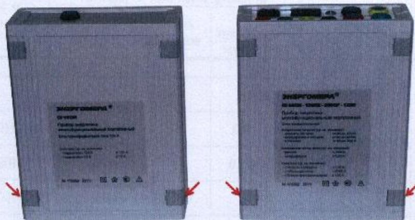
Рисунок 2 – Места пломбирования на нижних крышках блока трансформаторов тока (слева) и блока измерительного (справа) после поверки