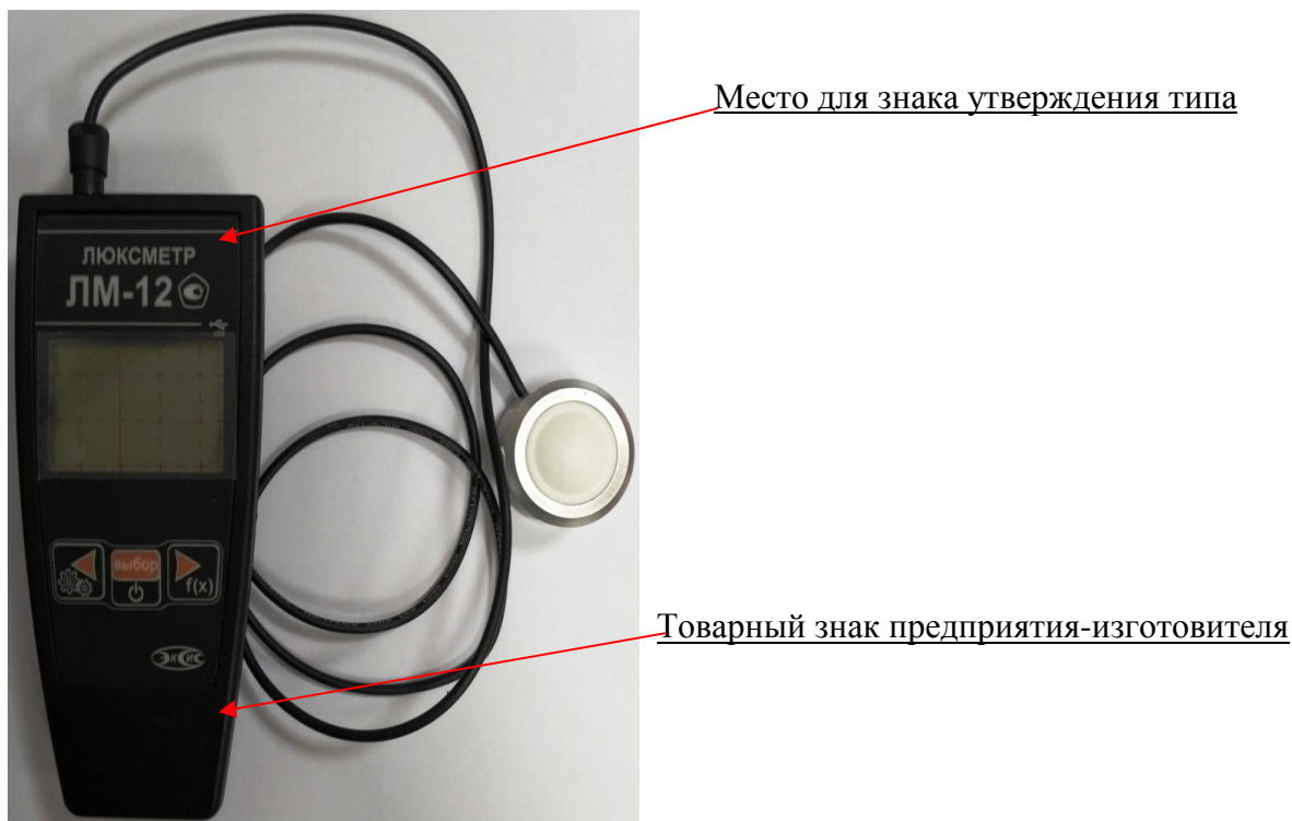
Рисунок 1 - Общий вид люксметров ЛМ-12

Схема пломбирования люксметров ЛМ-12 от несанкционированного доступа приведена на рисунке 2.