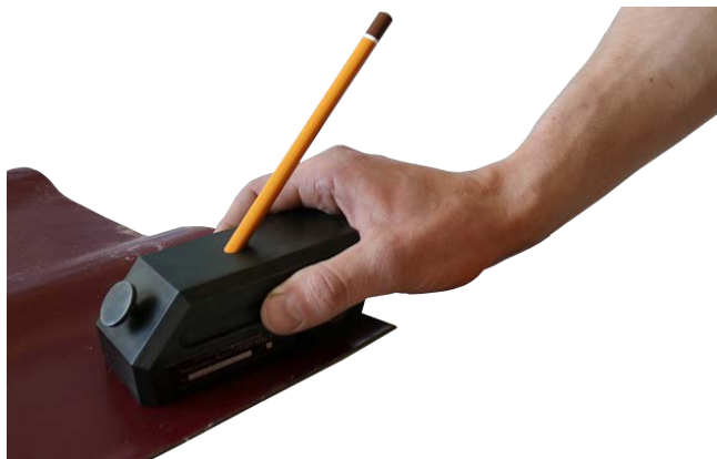
Рисунок 2.2 – Проведение испытания