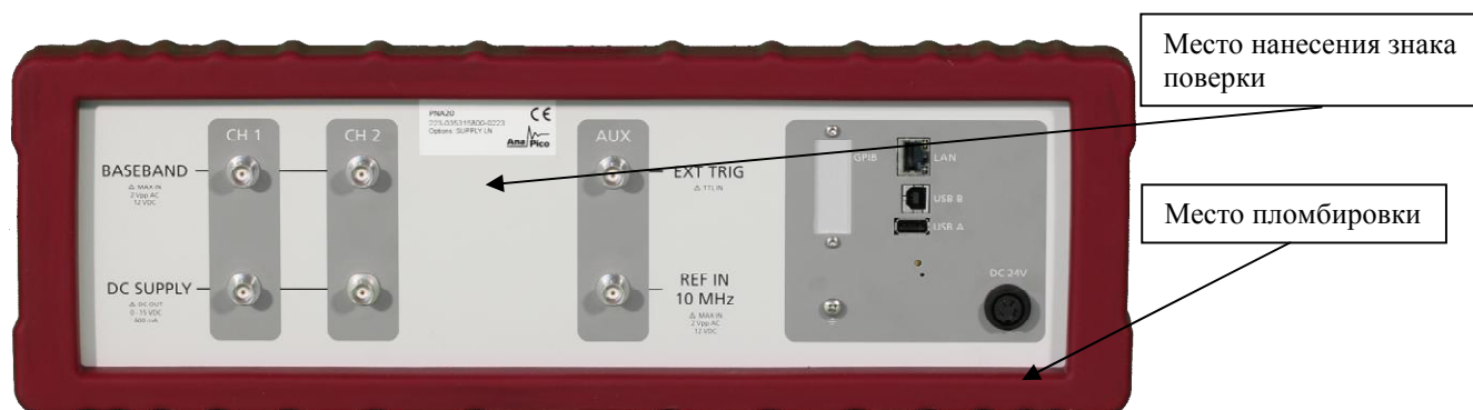
Рисунок 2 - Внешний вид задней панели анализаторов