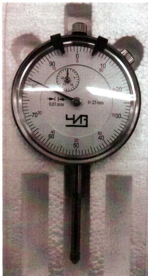
Рисунок 2 – Индикатор часового типа ИЧ 25