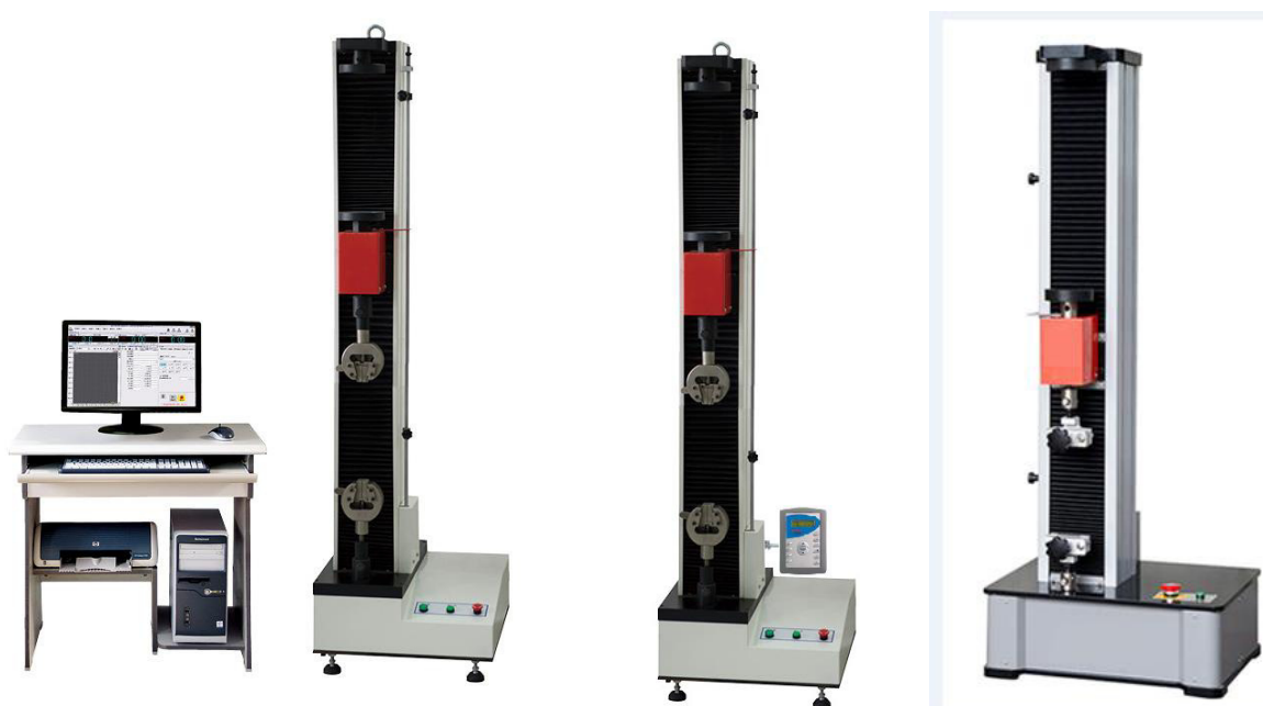
Рисунок 1 – Общий вид машин испытательных универсальных МТ (М) 110

Общий вид машин приведен на рисунках 1 и 2.