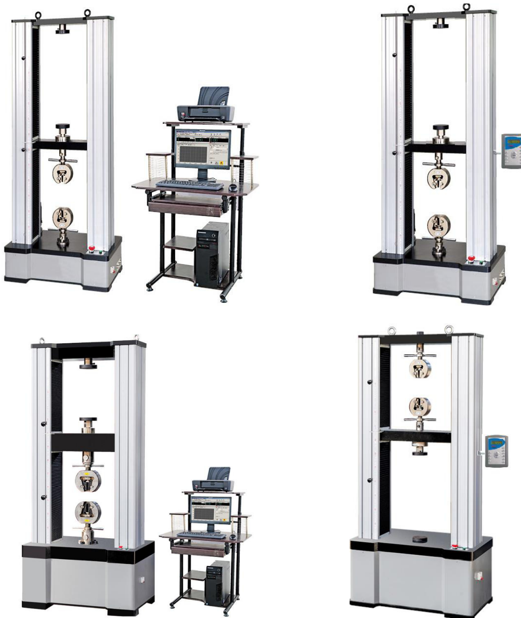
Рисунок 2 – Общий вид машин испытательных универсальных МТ (М) 120