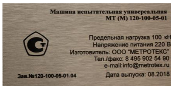
Рисунок 4 – Образец маркировочной таблички машины