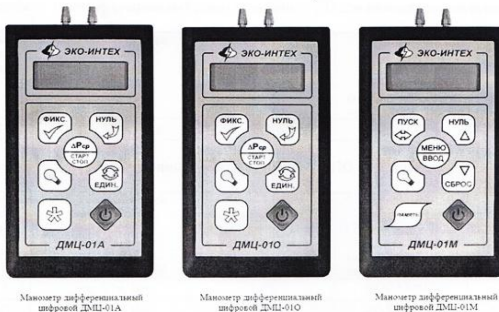
Рис. 1. Внешний вид манометров дифференциальных цифровых ДМЦ-01.