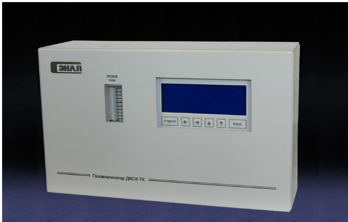
Рисунок 2 – Общий вид газоанализатора исполнения ДИСК-ТК-01