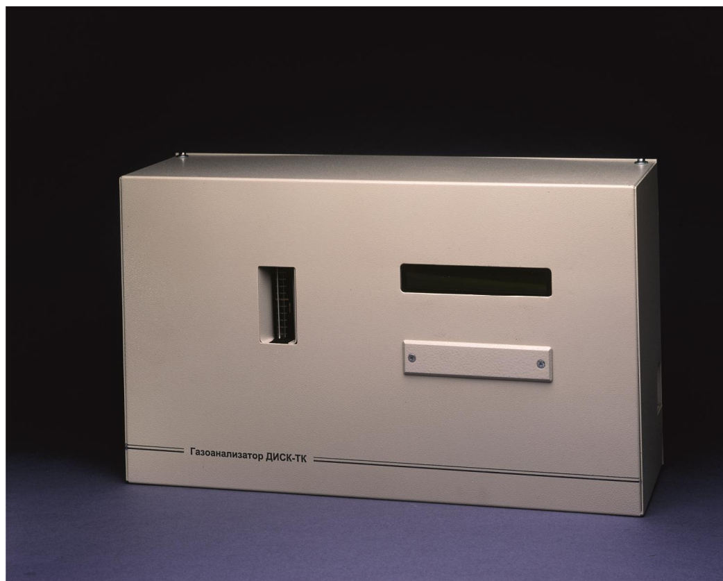
Рисунок 1 – Общий вид газоанализатора исполнения ДИСК-ТК

Пломбирование газоанализатора исполнения ДИСК-ТК-01 не предусмотрено.