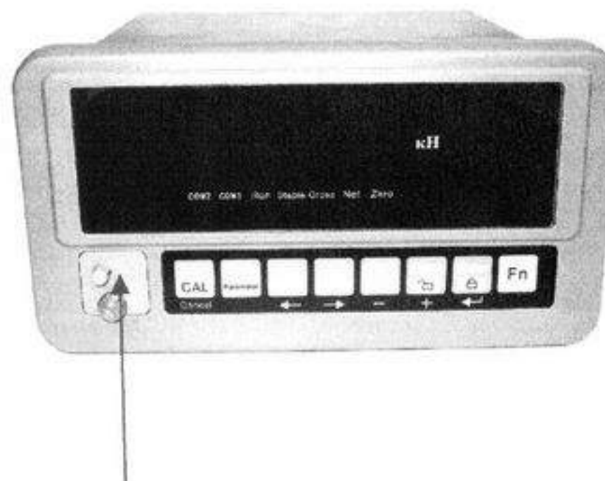
Место для нанесения оттиска поверительного клейма