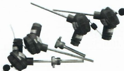
д) Комплекты термопреобразователей сопротивления платиновых КТС-Б