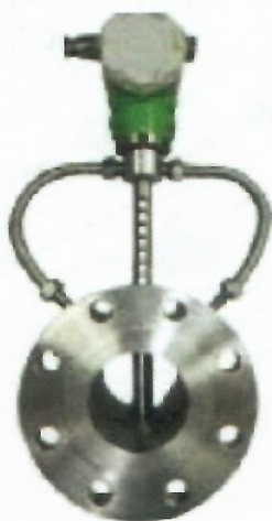
г) Преобразователи расхода вихревые «ЭМИС-ВИХРЬ 200(ЭВ 200)»