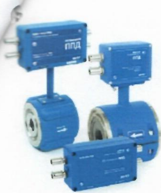
а) Расходомеры-счетчики ультразвуковые «ВЗЛЕТ МР»