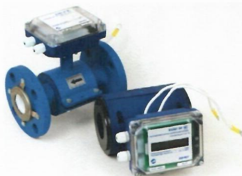
б) Расходомеры счетчики электромагнитные «ВЗЛЕТ ЭР» модификация «Лайт М»