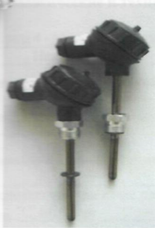
а) Комплекты термометров сопротивления из платины технически разностных КТПТР-01, КТПТР-03, КТПТР-06, КТПТР-07, КТПТР-08