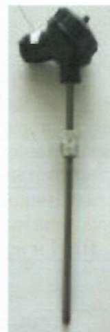
в) Термометры сопротивления из платины технические ТПТ-1, ТПТ-17, ТПТ-19, ТПТ-21, ТПТ-25Р