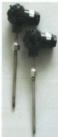
б) Комплекты термометров сопротивления из платины технически разностных КТПТР-04, КТПТР-05, КТПТР-05/1