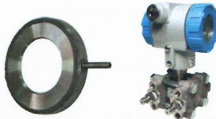
и) Диафрагмы по ГОСТ 8.586.2-2005 в комплекте с преобразователем давления измерительным АИР-20/М2-Н-ДД