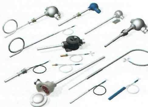
г) Термометры сопротивления платиновые ТСПТ, медные ТСМТ