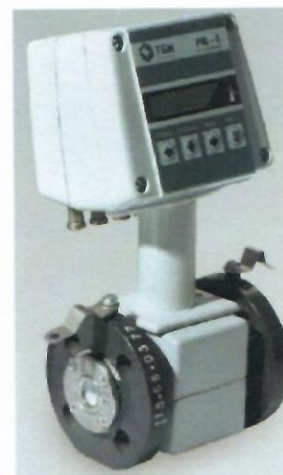
в) Счетчики-расходомеры электромагнитные РМ-5