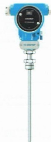
е) Термопреобразователи с унифицированным выходным сигналом ТПУ 0304