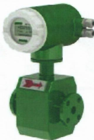
д) Расходомеры электромагнитные ЭМИС-МАГ 270