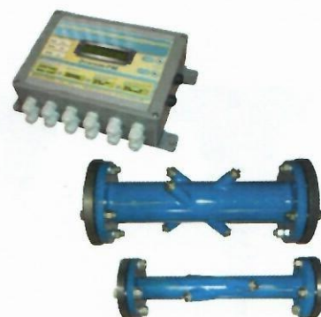
ж) Расходомеры-счетчики жидкости ультразвуковые многолучевые ЭТАЛОН-РМ