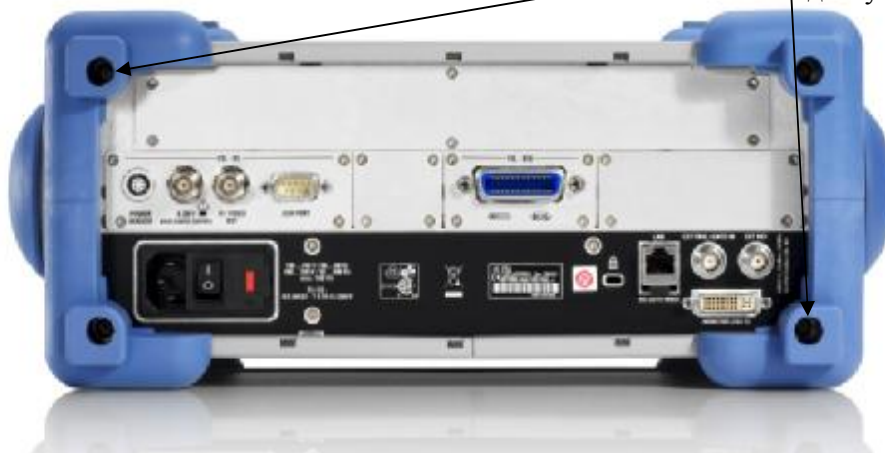
Рисунок 2. Схема пломбировки от несанкционированного доступа

места пломбировки от несанкционированного доступа