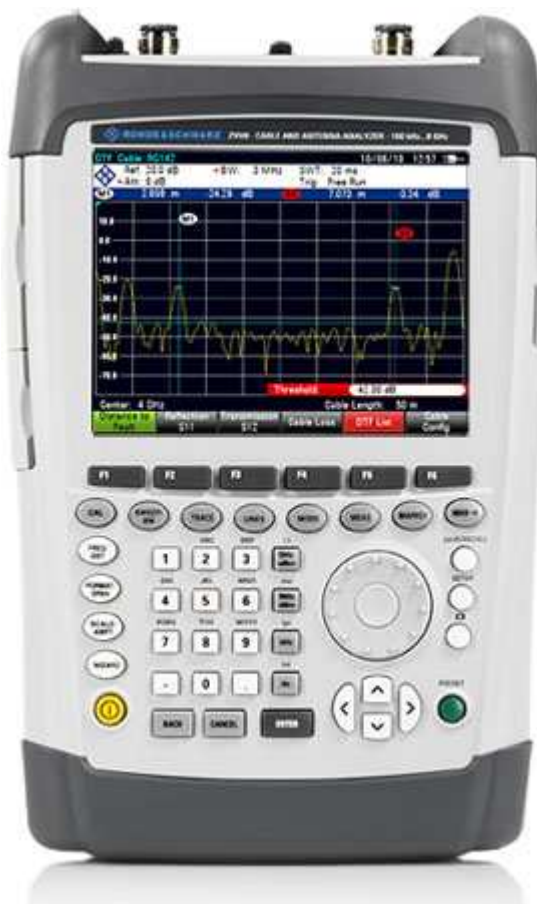
Внешний вид прибора

Знак утверждения типа, знак поверки, инвентарные и калибровочные наклейки наносятся на заднюю панель анализаторов кабельных трактов и антенн R&S ZVH4, R&S ZVH8.