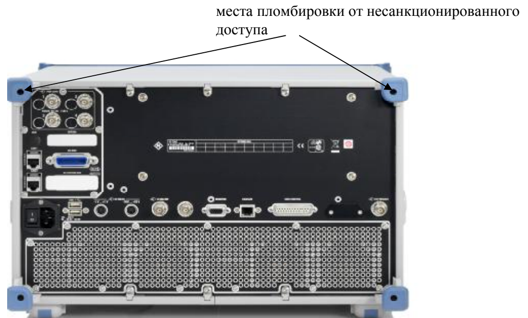
Рисунок 2. Схема пломбировки от несанкционированного доступа

Схема пломбировки от несанкционированного доступа, приведена на рисунке 2