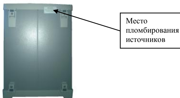
Рисунок 2 – Схема пломбирования источников