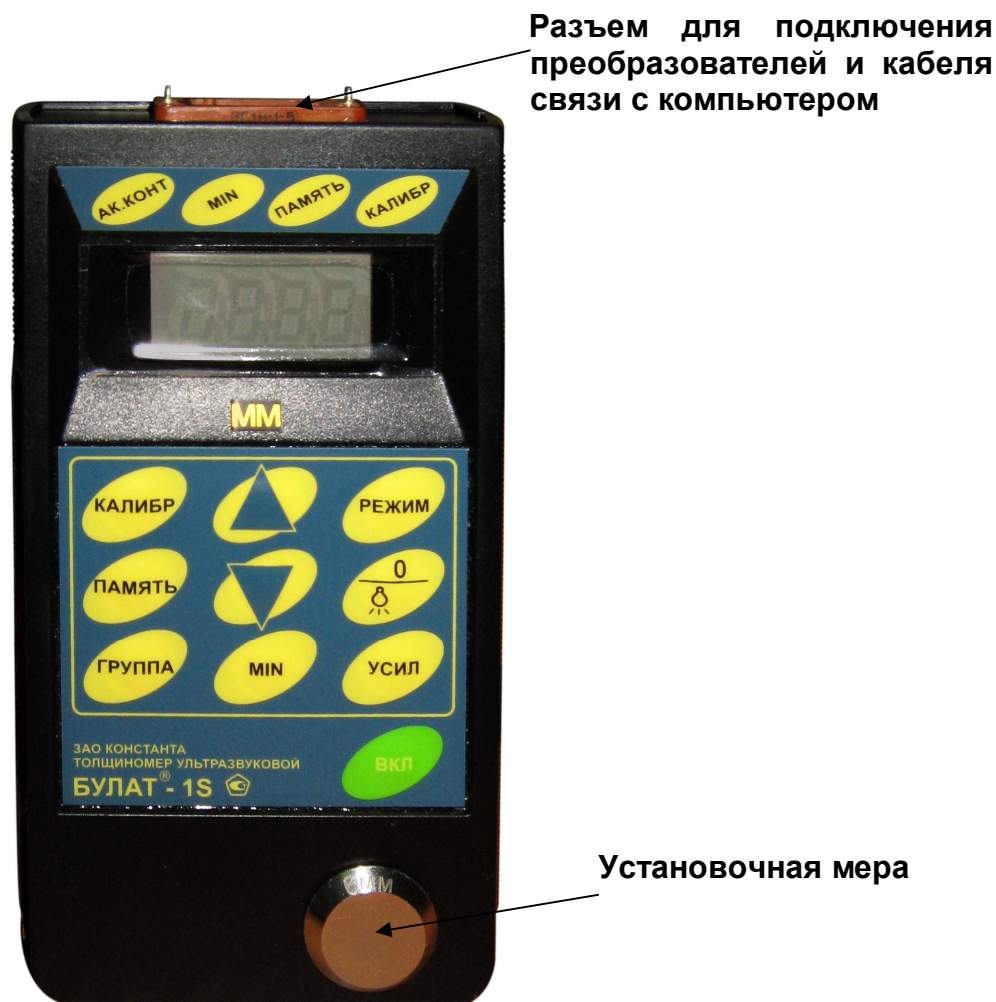
Рис.1. Булат 1S

Расположение клавиатуры и индикатора на лицевой панели блока обработки информации прибора приведено на рисунке 1.