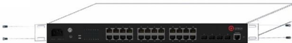
Присоединение монтажных скоб к корпусу

2 Аккуратно поместите коммутатор с прикрепленными к нему скобами в стойку. Закрепите коммутатор в стойке при помощи винтов из комплекта поставки. При установке коммутатора желательно оставить место вокруг для циркуляции воздуха.