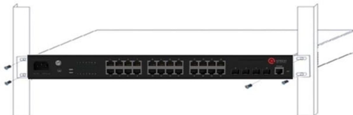
Установка коммутатора в стойку