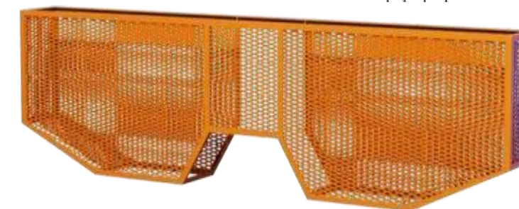
Ограждение на 180° из металлической решетки