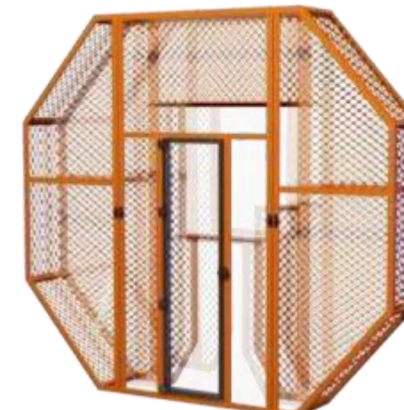
Круговое ограждение из перфорированного металла