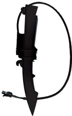
Образец зернового датчика