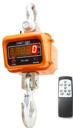
Рис. 3 ВЭК/3-[X]