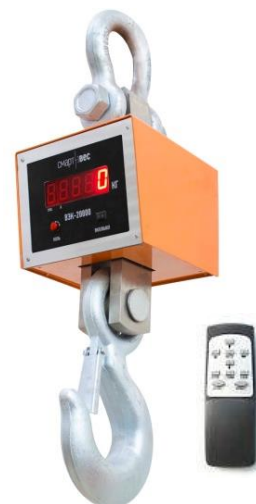
Рис. 4 ВЭК/4-[X]