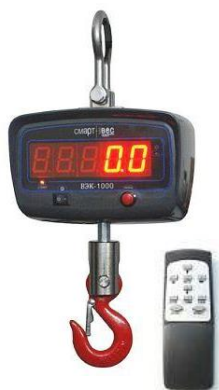
Рис. 2 ВЭК/2-[X]