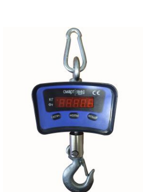
Рис. 1 ВЭК/1-[X]

Общий вид весов крановых ВЭК представлен на рисунках 1-8.