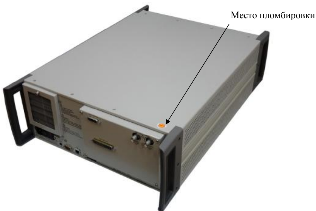
Рисунок 2 - Внешний вид калибратора