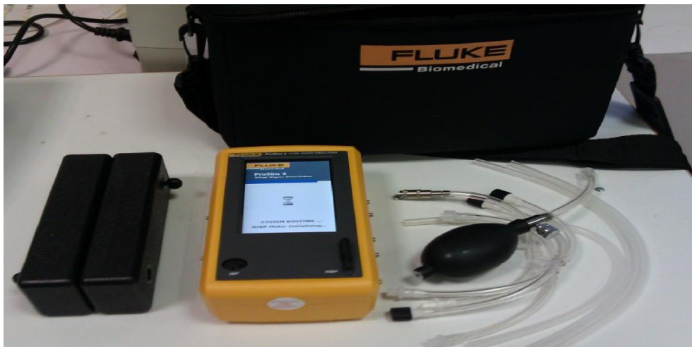
Рис. 1. Генератор сигналов пациента ProSim 4.